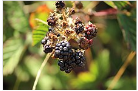
Mora en Ancud , Chiloé .

Las flores se producen a finales de la primavera y principios del verano en racimos cortos en las puntas de los laterales de floración. 6 Cada flor tiene unos 2-3 cm (0,8-1,2 plg) de diámetro, con cinco pétalos blancos o rosa pálido. 6