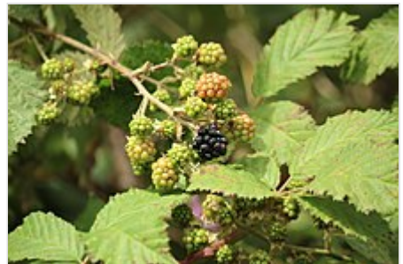
Moras en distintos puntos de maduración, en Ancud , Chiloé .