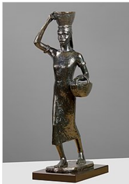
Mujer de las moras , escultura de Richmond Barthé, fundida en 1932.