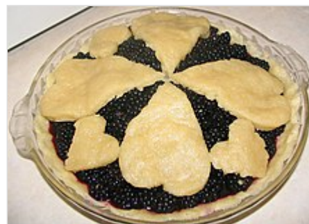
Tarta de moras.