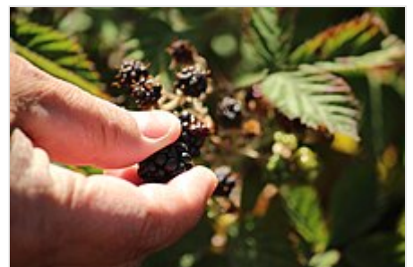
Mora siendo extraída en Ancud , Chiloé .