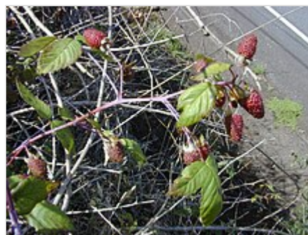
R. glaucus (mora andina o de Castilla). En fase de maduración, finalmente son de color morado oscuro.

Los árboles de esta especie se desarrollan bien en suelos frescos y ligeros, le perjudican las altas temperaturas y las zonas demasiado secas, aunque en climas excesivamente fríos se detiene o, cuanto menos, decrece su crecimiento. Para obtener una mejor producción de frutos se precisa una enérgica