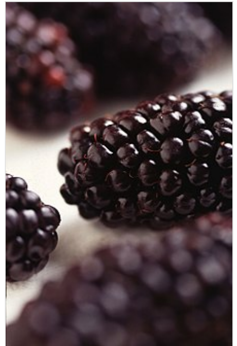
Cultivar del género Rubus 'Butte blackberry'