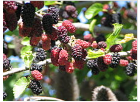
Moras en diferentes estados de madurez y color.

poda, lo que además hace que el árbol dé hojas más grandes. Se cultiva por siembra de semillas durante la primavera o bien por esquejes leñosos, y admite trasplantes a raíz desnuda durante el invierno . 15 Los frutos de esta especie maduran durante el verano .