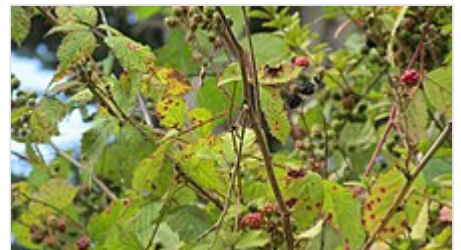
Mora de Rubus ulmifolius