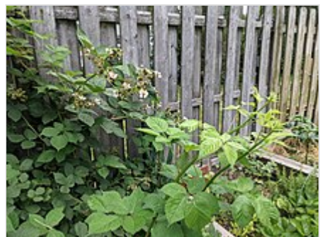
Florece los floricanos de segundo año y fructifican a la izquierda. Primocanes de primer año sin flores ni frutos creciendo a la derecha