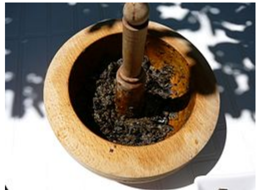
Tapenade en un mortero .