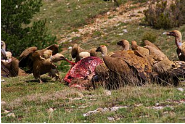
Buitres leonados alimentándose de una cierva en la Reserva Natural de Caza de Boumort, Lérida.

Los hábitos alimentarios de las especies del Nuevo Mundo han sido descritos menos detalladamente que los de los del Viejo Mundo. Sin embargo, todos localizan a sus presas exclusivamente mediante la vista, y no con el olfato. [ cita requerida ] Probablemente poseen una vista muy aguda, aunque no tanto como la de algunas rapaces que se alimentan de pequeños animales en movimiento. Los buitres pueden ver grandes animales muertos, o divisarse unos a otros, a distancias de varios kilómetros. Observan también a otras aves, y hasta a los leones y las hienas cuando estos andan en busca de alimentos. Como localizan a sus víctimas mediante la vista, no pueden hacerlo en zonas boscosas y, dado su poco sentido del olfato, no