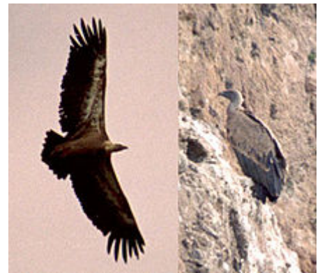
Buitre leonado planeando en busca de alimento.

Los hábitos alimenticios de cada tipo son bastante diferenciados, lo cual permite que todos sobrevivan. Los grandes buitres sociales pueden subdividirse ecológicamente en buitres de dorso blanco (anteriormente Pseudogyps ), que suelen criar en los árboles, y los buitres comunes ( Gyps ), que lo hacen colonialmente y en las rocas. Sin embargo, el buitre indio, perteneciente a la última clase, cría también en los árboles. En general, solo convive una especie de cada uno de los dos grupos últimamente mencionados, pero en el norte de la India se ha visto tres especies de las que crían en las rocas ( B. himalayensis , G. fulvus y G. indicus ) alimentándose a la vez del mismo animal muerto, así como a dos especies que criaban juntas.