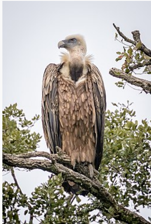
Buitre leonado ( Gyps fulvus )